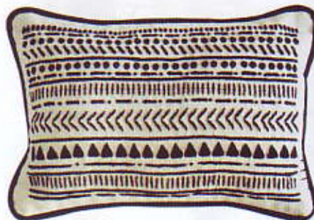
TISSÉ Coussin Little Nomad de 20 x 30 cm, Dark Night. Tomorrows With Heart, 50 €.

Fauteuil Floating, piètement en chêne massif et revêtement en tissu pixel. Red Edition, 1 590 €.